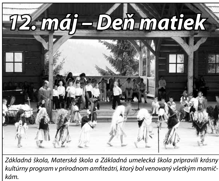
Základná škola, Materská škola a Základná umelecká škola pripravili krásny kultúrny program v prírodnom amfiteátri, ktorý bol venovaný všetkým mamičkám.